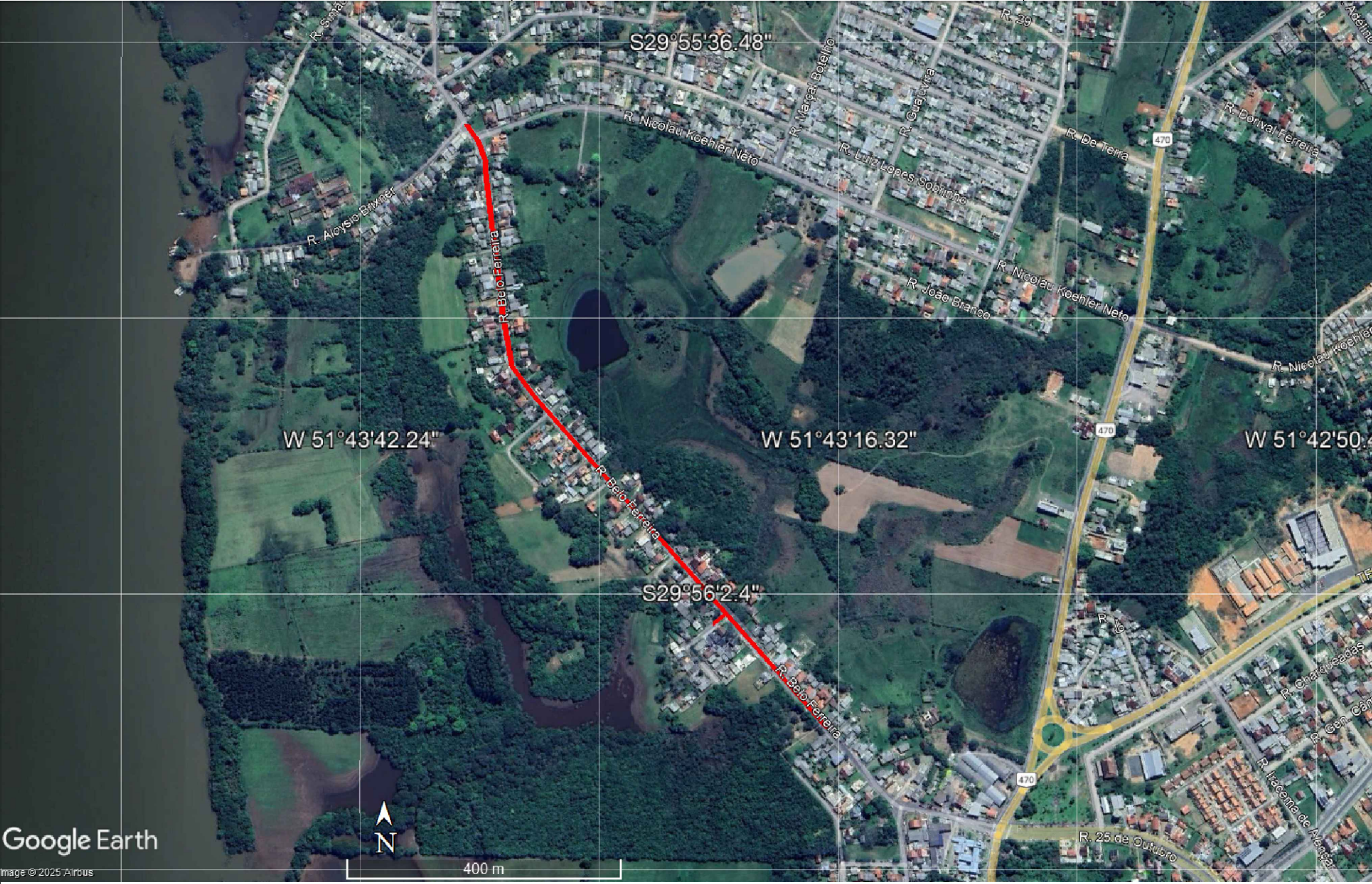
1 IMAGEM DE SATÉLITE SEM ESCALA